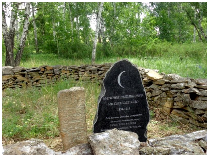
Рис.5.– Могила ахуна Ш.М. Матинова.

Здесь не сложно было отыскать могилу Ш. Матинова – ее выделяет прямоугольное, аккуратно выложенное каменное ограждение высотой в 0,8 м, длиной в 9 м, шириной в 7 метров, представляющее собой семейную усыпальницу (см. рис.5). На одном из плит мы смогли прочитать текст на башкирском языке, написанный на арабике, который в переводе на русский звучит так: «Ахун хазрат Шагишариф Матинов умер 23 января 1919 года». Дата смерти ахуна указана по старому стилю, по новому стилю это соответствует 3 февраля 1919 г. Таким образом, на основе этих данных устанавливается точная дата смерти ахуна Матинова – 23 января (3 февраля по н.с.) 1919 г.