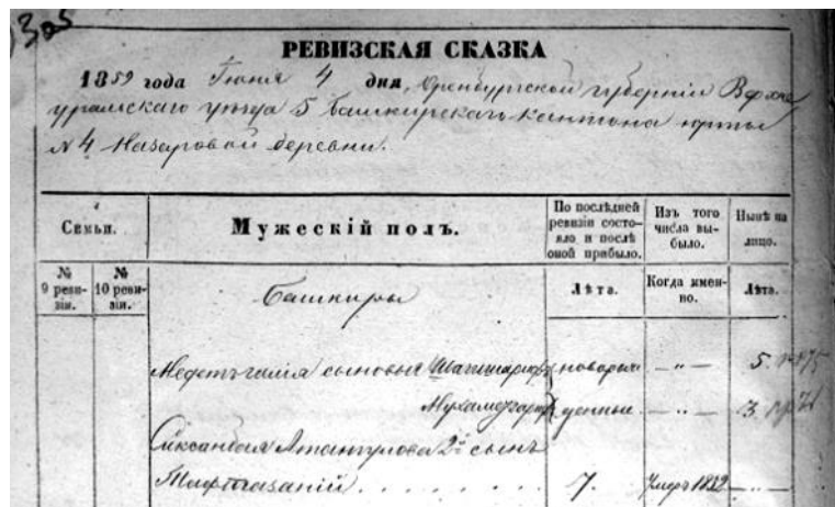
Рис. 2 – Запись в ревизской сказке 1859 г. по д. Назарово о рождении Шагишарифа и Мухаметгарифа Матиновых.

В целях установления точной даты рождения Ш. Матинова мы обратились к архивному источнику – метрической книге 1854 г. по д. Мустаево Бурзянской волости Верхнеуральского уезда, куда приходом была определена д. Назарово.