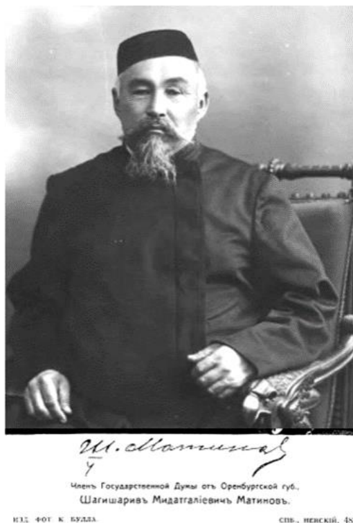
Рис.4 – Член Государственной Думы от Оренбургской губернии Шагишариф Мидатгалиевич Матинов [21].

Ш. Матинов, имея определенный финансовый достаток, проявлял себя и как меценат: оказывал финансовую помощь в строительстве башкирских школ и библиотек, направлял одаренных юношей из башкир на обучение в Оренбург и другие города. В памяти народа сохранились сведения о том, что он принимал активное участие в открытии новометодной – джадидской мусульманской школы в ауле Исян Бурзянской волости, где обратился к молодежи пламенной речью: «Благополучие и счастье нации – в просвещении, старайтесь, обучайтесь!».