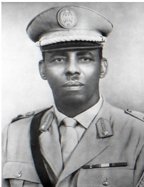
Мохаммед Сиад Барре

Наряду с этим необходимо учитывать, что кочевой образ жизни и связанные с ним перемещения привели к тому, что ни один клан не имеет какой-то фиксированной территории проживания, сохраняя при этом устойчивую клановую идентичность.