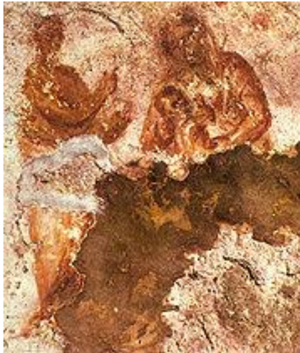
Рис. 1. Древнейшее известное изображение Богородицы с младенцем Иисусом. II век, Катакомбы Присциллы, Рим.

Ваш отец диавол; и вы хотите исполнять похоти отца вашего. Он был человекоубийца от начала и не устоял в истине, ибо нет в нем истины. Когда говорит он ложь, говорит свое, ибо он лжец и отец лжи (Ин. 8:42-44)».