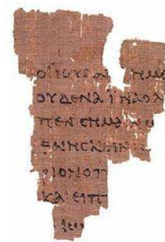
Рис. 2. Папирус P52, содержащий один из наиболее древних из найденных манускриптов Евангелия от Иоанна, датирован 125 годом н.э.

Палестине» из «Энциклопедии Христианской Апологетики Бейкера», – «Recent Discoveries in Palestine», from «Baker Encyclopedia of Christian Apologetics», Norman L. Geisler). «Находки, сделанные в Кумране, доказывают, что Новый Завет на самом деле является тем, чем мы его считаем: учением Христа и его непосредственных последователей и учеников между примерно 25 и 80 гг. н.э.» («От Каменного века до Христианства» – «From Stone Age to Christianity», 23).